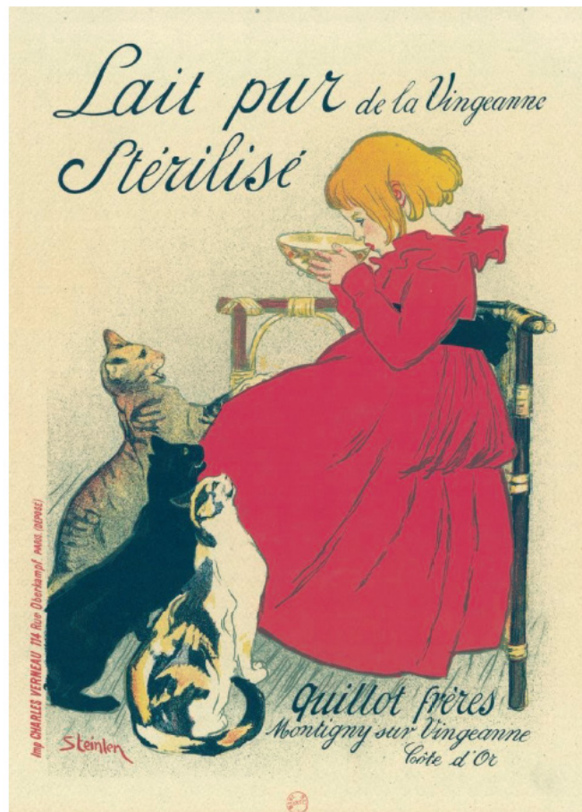
LAIT PUR DE LA VINGEANNE STÉRILISÉ (1895)

Los gatos han inspirado a pintores, escritores e intelectuales de toda época, género y condición, quienes escogieron además preferencialmente su compañía, dedicándoles obras memorables. De entre todos ellos, Théophile Alexandre Steinlen merece un puesto de honor en ese panteón felino, sabiendo captar por igual su nervio, su proverbial pereza y su carismática libertad. Su amor por los gatos fue tal que sus contemporáneos le apodaron popularmente “El padre de los gatos”.