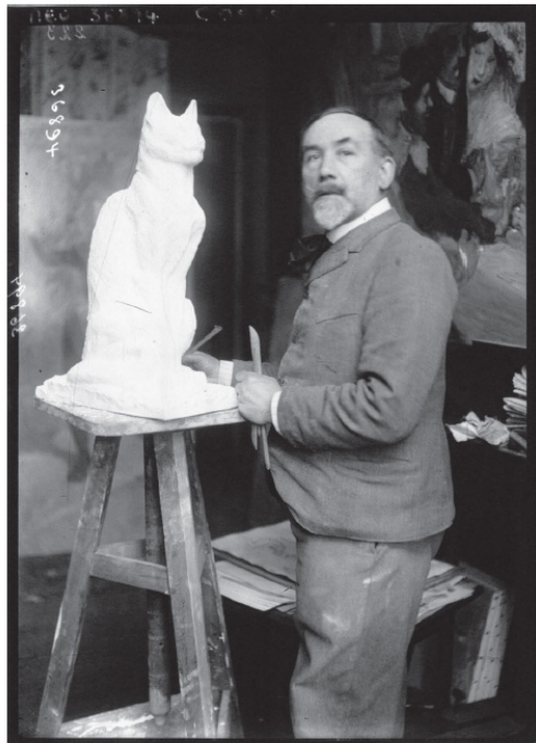
RETRATO DE STEINLEN MODELANDO LA ESCULTURA DE UN GATO (1913)

Théophile Alexandre Steinlen, conocido como Steinlen (1859-1923) fue un pintor, litógrafo y diseñador gráfico especializado en cartelería de origen suizo. Steinlen, conocido por incluir gatos en sus obras hace, además, referencia en sus obras a las desigualdades del París de principios del siglo XX desmarcándose de la posición de clases y el carácter idealizador del art nouveau . Su cartel Cabaret Le Chat Noir (1896) ya en la categoría de icono, especialmente para los amantes del diseño, la ilustración y el arte, fue uno de los primeros que acercó el diseño a las grandes masas en una época en la que no era necesario saber leer para saber qué se estaba publicitando. Steinlen, el padre de los gatos, es uno de los artistas más conocidos, y a la vez desconocidos, de todos los tiempos.